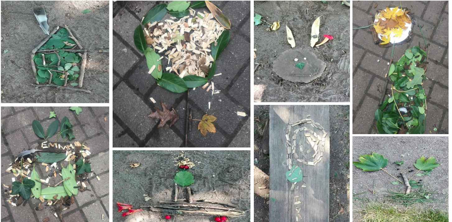
Landart-Projekt mit Grundschulkindern

Im Februar war es soweit. Nach Umbaumaßnahmen konnten zwei neue Kindergartengruppe in der Kita Wüstenmäuse eröffnet werden, so dass wir seitdem insgesamt 95 Kinder betreuen können. Die Kinder, die zuvor im „Pavillon“ betreut wurden, zogen in die neuen Räumlichkeiten der Wüstenmäuse um. Neben den neuen Kindern und Familien begrüßen wir zudem unsere neuen Kolleg*innen ganz herzlich.