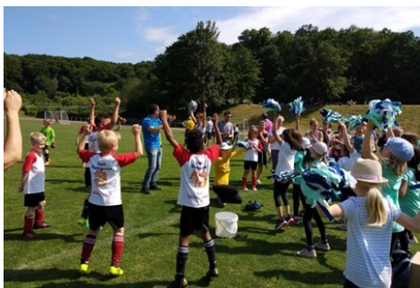
Pokaljubiläum beim Hort Sutthausen

Unser Hort Sutthausen mit seinen zwei Regelgruppen konnte im Juni einen großen Erfolg beim Osnabrücker Hort-Fußballturnier verzeichnen. Angefeuert durch die eigene Cheerleadertruppe belegt unser Team Sutthausen den ersten Platz und hat sich den Pokal geholt.