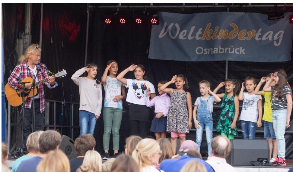
Auftritt des Musikprojekts K3 beim Weltkindertag 2019

Kinderbetreuung im Erich-Maria-Remarque-Haus